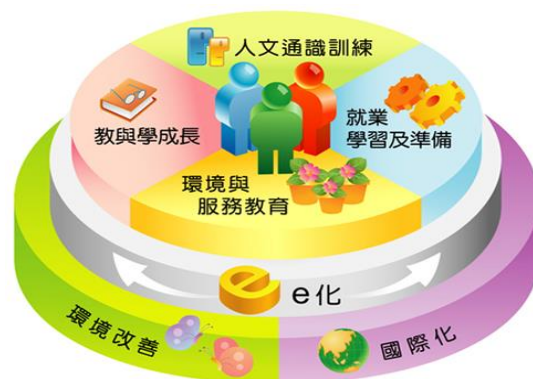
三圓一同心的東海卓越教學

本校教學卓越計畫秉持教學理念及考量整體校務發展，本年度再經整合規劃以「三圓一同心之東海卓越教學」(如圖示)為執行主軸，為延續優良校風，在教育各面向重整提出包含「教與學成長」、「人文通識訓練」、「環境與服務教育」及「就業學習及準備」等四大子計畫，為同心圓的基礎，同心圓的第二圓為 e 化，以建置全方位的 e 化校園為目標，除了提升 e 化行政效率，也提升學子的 e 化教育及教師 e 化教學。同心圓的第三圓為環境改善與國際化，藉此提供學生享受永續教學環境及國際化的友善校園。期許激勵教師提升教學專業，並引起學生主動學習的熱忱與興趣，在全人教育的課程規劃與薰陶下，孕育出具有國際競爭力的國家棟樑。